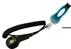
Lecteur USB pour PC

A chaque fois que vous lisez un Thermo Bouton, vous pouvez envoyer automatiquement un email à la personne de votre choix et lui indiquer qu'elle peut consulter immédiatement la courbe. Quand vous missionnez un Bouton, vous pouvez également choisir un destinataire et l'informer d'un relevé en cours